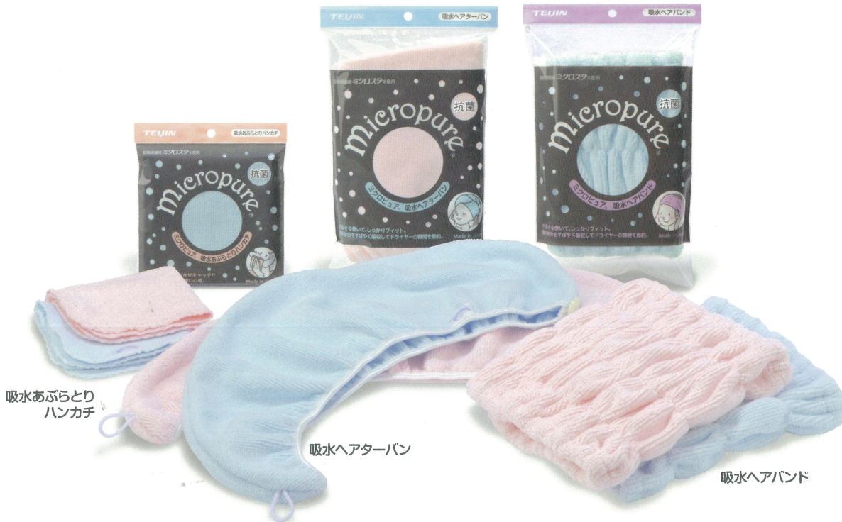
吸水あぶらとり ハンカチ